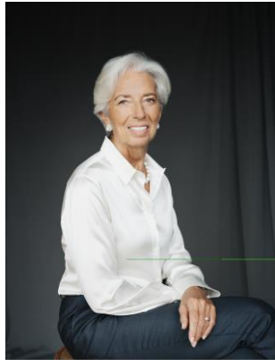
Christine Lagardová, predsedníčka Európskeho výboru pre systémové riziká

Je pre mňa veľkým potešením predložiť vám trinástu výročnú správu Európskeho výboru pre systémové riziká (European Systemic Risk Board – ESRB), ktorá hodnotí obdobie od 1. apríla 2023 do 31. marca 2024. Táto správa, adresovaná spoluzákonomdarcom v Európskej únii a širokej európskej verejnosti, vysvetľuje, ako ESRB plnil svoj mandát. Je dôležitou súčasťou rámca transparentnosti a zodpovednosti ESRB.