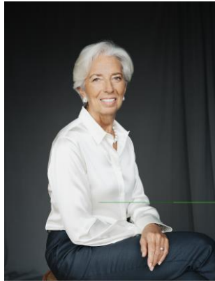
Kristine Lagarda, Eiropas Sistēmisko risku kolēģijas priekšsēdētāja

Ļoti priecājos iepazīstināt jūs ar Eiropas Sistēmisko risku kolēģijas (ESRK) trīspadsmito gada pārskatu, kas aptver laikposmu no 2023. gada 1. aprīļa līdz 2024. gada 31. martam.