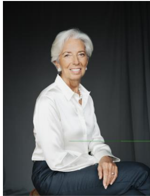
predsjednica Europskog odbora za sistemske rizike Christine Lagarde

S velikim zadovoljstvom predstavljam trinaesto godišnje izvješće Europskog odbora za sistemske rizike (engl. European Systemic Risk Board, ESRB ), koje obuhvaća razdoblje od 1. travnja 2023. do 31. ožujka 2024. Ovim izvješćem, koje je upućeno suzakonodavcima u Europskoj uniji i europskoj javnosti općenito, objašnjavamo kako je ESRB ispunio svoj mandat. Godišnje izvješće važan je dio ESRB-ova okvira transparentnosti i odgovornosti.