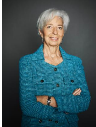
Christine Lagardová, predsedníčka Európskeho výboru pre systémové riziká

Je pre mňa veľkým potešením predložiť vám dvanástu výročnú správu Európskeho výboru pre systémové riziká (European Systemic Risk Board – ESRB), ktorá hodnotí obdobie od 1. apríla 2022 do 31. marca 2023. Správa je dôležitou súčasťou rámca transparentnosti a zodpovednosti ESRB. Prostredníctvom tejto správy, adresovanej spoluzákonomdarcom v Európskej únii a širokej európskej verejnosti, vysvetľujeme, ako ESRB plnil svoj mandát.