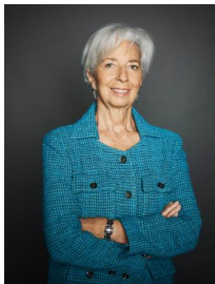
Christine Lagarde, voorzitter van het Europees Comité voor systeemrisico's

Met veel genoegen presenteer ik hierbij het twaalfde jaarverslag van het Europees Comité voor systeemrisico's (European Systemic Risk Board – ESRB), dat betrekking heeft op de periode van 1 april 2022 tot en met 31 maart 2023. Het verslag vormt een belangrijk onderdeel van het kader voor transparantie en verantwoording van het ESRB. Met dit verslag, dat is gericht aan de medewetgevers in de Europese Unie en de Europese burgers, leggen we uit hoe het ESRB zijn mandaat heeft vervuld.