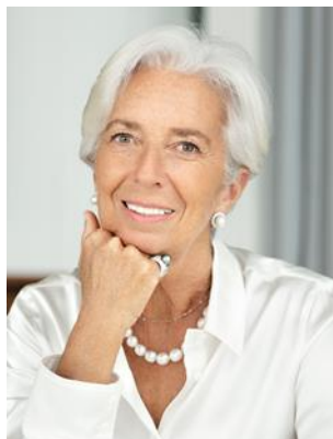
Christine Lagardová, predsedníčka Európskeho výboru pre systémové riziká

Je pre mňa veľkým potešením predložiť vám jedenástu Výročnú správu Európskeho výboru pre systémové riziká (European Systemic Risk Board – ESRB), ktorá hodnotí obdobie od 1. apríla 2021 do 31. marca 2022. Výročná správa ESRB je dôležitou súčasťou komunikačného rámca ESRB, ktorá má za cieľ zabezpečiť transparentnosť a zodpovednosť v plnení jeho mandátu. Správa je adresovaná spoluzákonomdarcom v Európskej únii i širokej európskej verejnosti.