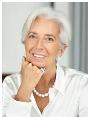
Eiropas Sistēmisko risku kolēģijas priekšsēdētāja Kristīne Lagarda

Ļoti priecājos iepazīstināt jūs ar Eiropas Sistēmisko risku kolēģijas (ESRK) vienpadsmito gada pārskatu, kas aptver laikposmu no 2021. gada 1. aprīļa līdz 2022. gada 31. martam.