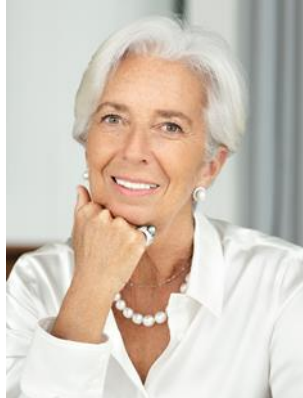
Christine Lagarde, Cathaoirleach an Bhoird Eorpaigh um Riosca Sistéamach (BERS)

Táim an-sásta an 11ú Tuarascáil Bhliantúil de chuid an Bhoird Eorpaigh um Riosca Sistéamach (BERS) a chur i láthair, a chlúdaíonn an tréimhse idir an 1 Aibreán 2021 agus an 31 Márta 2022. Is cuid thábhachtach de chreat cumarsáide BERS í Tuarascáil Bhliantúil BERS. Is é is aidhm léi an trédhearcacht agus an chuntasacht a chinntiú maidir leis an gcaoi a gcuireann BERS i gcrích a shainordú agus is ar chomhreachtóirí san Aontas Eorpach agus ar phobal na hEorpa i gcoitinne a dhírítear í.