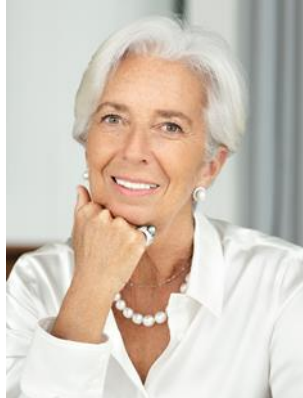
Christine Lagarde, Euroopan järjestelmäriskikomitean puheenjohtaja

Euroopan järjestelmäriskikomitean (EJRK) 11. vuosikertomus kattaa ajanjakson 1.4.2021–31.3.2022. Vuosikertomus on tärkeä osa EJRK:n viestintää. Siinä kerrotaan avoimuuden ja tilivelvollisuuden periaatteiden mukaisesti muille lainsäätäjille ja EU:n kansalaisille, miten EJRK on hoitanut mandaattinsa mukaisia tehtäviä.