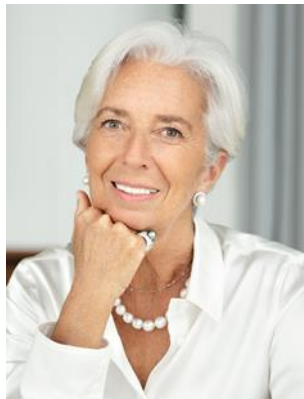
Кристин Лагард, председател на Европейския съвет за системен риск

За мен е голямо удоволствие да представя единнадесетия Годишен доклад на Европейския съвет за системен риск (ЕССР), който обхваща периода от 1 април 2021 г. до 31 март 2022 г. Докладът на ЕССР е важна част от неговата комуникационна рамка. Предназначението му е да осигури прозрачност и отчетност за това как ЕССР изпълнява мандата си. Негови адресати са законодателните органи на Европейския съюз и широката европейска общественост.