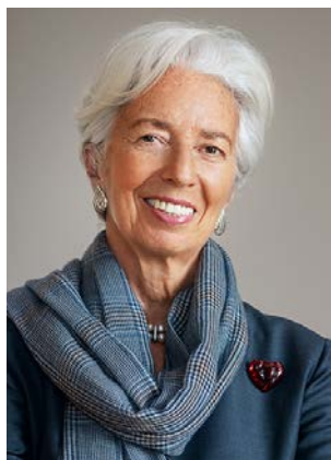
Christine Lagardová, predsedníčka Európskeho výboru pre systémové riziká

Deviata výročná správa ESRB sa vzťahuje na rok od 1. apríla 2019 do 31. marca 2020. Toto obdobie síce zahŕňa počiatkové štádium pandémie koronavírusu (COVID-19), no hospodárske a finančné následky krízy, ktorú spôsobila, naďalej rýchlo rástli aj v nasledujúcich mesiacoch. Tohtoročná výročná správa v záujme zohľadnenia nových systémových rizík pre európske hospodárstvo v dôsledku tohto mimoriadneho makroekonomického šoku výnimočne obsahuje hodnotenie rizík ESRB až do júna 2020.