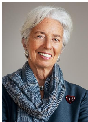
Christine Lagarde, voorzitter van het Europees Comité voor systeemrisico's

Het negende jaarverslag van het Europees Comité voor systeemrisico's (European Systemic Risk Board – ESRB) bestrijkt het jaar van 1 april 2019 tot en met 31 maart 2020. Hoewel het begin van de coronaviruspandemie (Covid-19) ook in die periode valt, zijn de economische en financiële gevolgen van de coronacrisis in de daaropvolgende maanden zich snel blijven ontwikkelen. Om die reden bevat dit jaarverslag – bij wijze van uitzondering – eveneens de beoordeling door het ESRB van de risico's tot juni 2020. Dit om de nieuwe systeemrisico's weer te geven die zijn ontstaan doordat de Europese economie met deze buitengewone macro-economische schok te maken heeft gekregen.