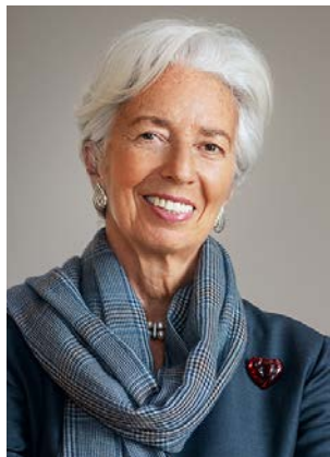
Kristine Lagarda (Christine Lagarde), Eiropas Sistēmisko risku kolēģijas priekšsēdētāja

Devītajā ESRK gada pārskatā aptverts periods no 2019. gada 1. aprīļa līdz 2020. gada 31. martam. Šis periods ietver koronavīrusa (Covid-19) pandēmijas pašu sākumu, taču turpmākajos mēnešos Covid-19 krīzes ekonomiskās un finanšu sekas turpinājušas strauji attīstīties. Tāpēc šajā gada pārskatā kā izņēmums ietverts tikai ESRK risku novērtējums laikposmam līdz 2020. gada jūnijam, lai atspoguļotu jaunus sistēmiskos riskus, kas radušies, Eiropas tautsaimniecībai pārciešot šo ārkārtīgi smago makroekonomisko šoku.