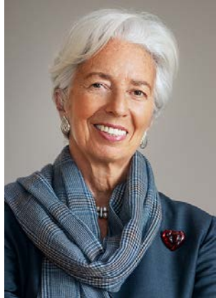
Christine Lagarde, EJRK:n puheenjohtaja

Euroopan järjestelmäriskikomitean (EJRK) yhdeksäs vuosikertomus kattaa ajanjakson 1.4.2019–31.3.2020. Koronaviruspandemian (COVID-19) puhkeaminen ajoittuu tälle ajanjaksolle, mutta monet tämän kriisin vaikutukset talouteen ja rahoitusoloihin ovat ilmenneet vasta jaksoa seuranneina kuukausina. Tästä syystä vuosikertomukseen sisältyvä EJRK:n riskiarvio ulottuu poikkeuksellisesti kesäkuuhun 2020 asti, jotta EU:n talouteen kohdistuvan epätavanomaisen makrotaloudellisen sokin aiheuttamat uudet järjestelmäriskit pystytään ottamaan huomioon.