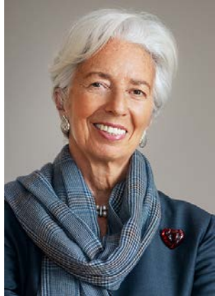
Christine Lagarde, Euroopa Süsteemsete Riskide Nõukogu eesistuja

ESRNi üheksas aastaaruanne käsitleb ajavahemikku 1. aprillist 2019 kuni 31. märtsini 2020. See ajavahemik hõlmas küll koroonaviiruse (COVID-19) pandeemia puhkemist, kuid COVID-19 põhjustatud kriisi majandus- ja finantstagajärgede kiire areng jätkus ka järgnevatel kuudel. Seetõttu sisaldab käesolev aastaaruanne erandkorras ESRNi riskihinnangut kuni 2020. aasta juunini, et kajastada selle Euroopa majandust mõjutava erakorralise makromajandusliku šoki kontekstis tekkinud uusi süsteemseid riske.