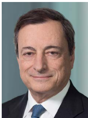
Mario Dragi, Eiropas Sistēmisko risku kolēģijas priekšsēdētājs

Eiropas Sistēmisko risku kolēģijas (ESRK) astotais gada pārskats aptver laikposmu no 2018. gada 1. aprīļa līdz 2019. gada 31. martam. Kā ierasts, ESRK cieši monitorēja Eiropas finanšu sistēmas un tautsaimniecības sistēmiskā riska avotus. Četri galvenie identificētie riski salīdzinājumā ar iepriekšējo gadu nav mainījušies: riska prēmiju pārcenošana pasaules finanšu tirgos ir būtiskākais uzdevums, kam seko ES banku, apdrošināšanas sabiedrību un pensiju shēmu ilgstoši vājais bilanču stāvoklis, parāda atmaksājamības problēmas ES valsts, uzņēmumu un mājsaimniecību sektorā un, visbeidzot, ievainojamība ieguldījumu fondu sektorā un paralēlo banku darbības radītie riski. Tas ir īpaši būtiski, ņemot vērā politikas nenoteiktību un straujāku, nekā gaidīts, ekonomiskās izaugsmes palēnināšanos.