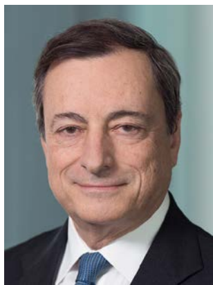
Mario Draghi, Presidente del Comitato europeo per il rischio sistemico

L'ottavo Rapporto annuale del Comitato europeo per il rischio sistemico (CERS) si riferisce al periodo compreso fra il 1° aprile 2018 e il 31 marzo 2019. Il CERS, come in passato, ha seguito con attenzione le fonti di rischio sistemico nel sistema finanziario e nell'economia a livello europeo. I quattro rischi principali rilevati dal CERS coincidono con quelli individuati lo scorso anno. Fra questi predomina la rivalutazione dei premi al rischio nei mercati finanziari globali; seguono le persistenti debolezze nei bilanci di banche, compagnie di assicurazione e sistemi pensionistici dell'UE, le sfide sul piano della sostenibilità del debito sovrano e del debito di imprese e famiglie nell'UE e infine le vulnerabilità nel settore dei fondi di investimento e i rischi derivanti dall'attività bancaria ombra. Questi rischi assumono particolare rilevanza in un contesto caratterizzato da incertezze sul piano delle politiche e una moderazione della crescita economica più rapida di