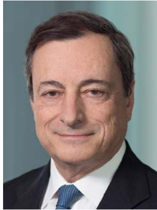
Mario Draghi, EJRK:n puheenjohtaja

Euroopan järjestelmäriskikomitean (EJRK) kahdeksas vuosikertomus kattaa ajanjakson 1.4.2018–31.3.2019. Tuona aikana EJRK seurasi edelleen tarkasti Euroopan rahoitusjärjestelmään ja talouteen liittyviä tekijöitä, joista voi aiheutua järjestelmäriskejä. Neljä keskeistä riskitekijää ovat samat kuin jo edellisellä vuosikertomuskaudella. Niistä huomattavin on riskipreemioiden uudelleenhinnoittelu kansainvälisillä rahoitusmarkkinoilla. Muut keskeiset riskit liittyvät EU:n pankkien, vakuutuslaitosten ja eläkerahastojen taseiden jatkuvaan heikkouteen, EU:n julkisen sektorin sekä yritys- ja kotitaloussektorien velkakestävyysongelmiin sekä sijoitusrahastosektorin heikkouksiin ja pankkisektorin ulkopuoliseen rahoituksenvälitykseen. Riskiarviota leimaavat vallitseva poliittinen epävarmuus sekä talouskasvun ennakoitua selvempi hidastuminen.