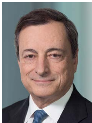
Mario Draghi, Euroopa Süsteemsete Riskide Nõukogu eesistuja

Euroopa Süsteemsete Riskide Nõukogu (ESRN) kaheksas aastaaruanne hõlmab ajavahemikku 1. aprillist 2018 kuni 31. märtsini 2019. Nagu tavaliselt, jälgis ESRN tähelepanelikult süsteemse riski allikaid Euroopa finantsüsteemis ja majanduses. Neli peamist tuvastatud riskiallikat on eelmise aastaga võrreldes samad. Neist silmapaistvaim on riskipreemiate ümberhindlus üleilmsetel finantsturgudel, millele järgneb ELi pankade, kindlustusandjate ja pensioniskeemide bilansside püsiv nõrkus. Ülejäänud kaks riskiallikat on võla jätkusuutlikkusega seotud probleemid ELi valitsemis-, ettevõtlus- ja kodumajapidamiste sektoris ning investeerimisfondide sektori haavatavus ja varipangandussektori tegevusest tulenevad riskid. Eriti aktuaalsed on need riskid poliitilise ebakindluse tingimustes ja majanduskasvu oodatust kiirema aeglustumise taustal.