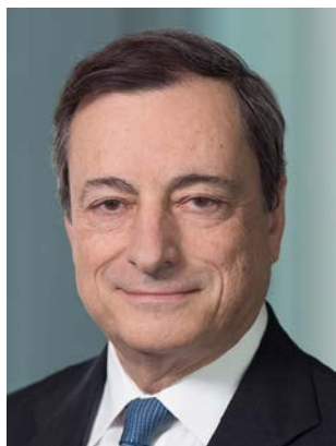
Марио Драги, председател на Европейския съвет за системен риск

Осмият Годишен доклад на Европейския съвет за системен риск (ЕССР) обхваща периода от 1 април 2018 г. до 31 март 2019 г. Както обикновено ЕССР наблюдава внимателно източниците на системен риск в европейската финансова система и в икономиката. Идентифицираните четири основни риска остават същите, както през предходната година, като преоценяването на рисковите премии на световните финансови пазари е най-същественният, следван от непреодолените слабости в балансите на банките, застрахователните дружества и пенсионните фондове в ЕС, проблемите с устойчивостта на дълга в секторите на държавните дългове, фирмените дългове и дълговете на домакинствата в ЕС и, на последно място, уязвимости в сектора на инвестиционните фондове и рискове от нерегулирани банкови дейности. Тези рискове са особено важни на фона на политическата несигурност и по-бързото от очакваното отслабване на икономическия растеж.