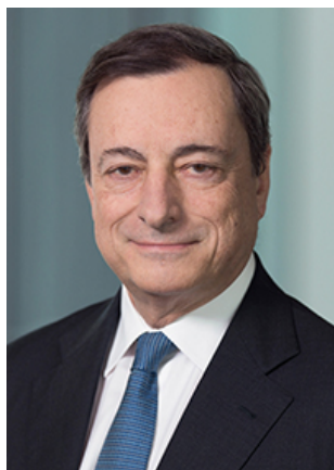
Mario Draghi, Voorzitter van het Europees Comité voor Systeemrisico's

Het zevende Jaarverslag van het Europees Comité voor Systeemrisico's (European Systemic Risk Board of ESRB) bestrijkt de periode van 1 april 2017 tot en met 31 maart 2018. Het ESRB heeft de bronnen van systeemrisico's in het Europese financiële stelsel en de Europese economie tijdens de verslagperiode opnieuw nauwgezet gevolgd en vier belangrijke risico's voor de financiële stabiliteit in de Europese Unie (EU) vastgesteld. In dit kader heeft het ESRB de ontwikkelingen in de sectoren commercieel vastgoed en niet-bancaire financiële instellingen geanalyseerd.