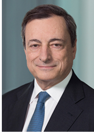
Mario Draghi, EJRK:n puheenjohtaja

Euroopan järjestelmäriskikomitean (EJRK) seitsemäs vuosikertomus kattaa ajanjakson 1.4.2017–31.3.2018. Tuona aikana EJRK seurasi edelleen tarkasti rahoitusjärjestelmään ja talouteen liittyviä tekijöitä, joista voi aiheutua rahoitusvakautta uhkaavia järjestelmäriskejä Euroopan unionissa (EU). Se havaitsi neljä keskeistä riskiä.