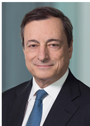
Mario Draghi, Formand for Det Europæiske Udvalg for Systemiske Risici

Dette er den syvende årsberetning fra Det Europæiske Udvalg for Systemiske Risici (ESRB). Beretningen dækker perioden 1. april 2017 til 31. marts 2018. I den betragtede periode fortsatte ESRB den tætte overvågning af kilder til systemisk risiko i det finansielle system og økonomien i Europa, og identificerede fire væsentlige risici for finansiell stabilitet i Den Europæiske Union (EU). Som led i dette arbejde analyserede ESRB udviklingen inden for erhvervsejendomssektoren og den finansielle sektor ekskl. banksektoren.