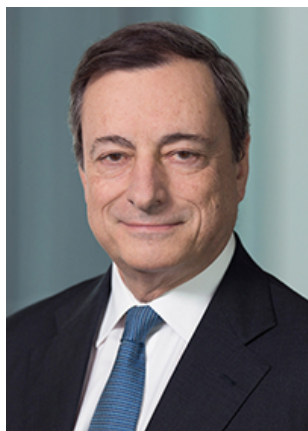
Mario Draghi, předseda Evropské rady pro systémová rizika

Tato sedmá výroční zpráva Evropské rady pro systémová rizika (ESRB) se vztahuje na období od 1. dubna 2017 do 31. března 2018. Během sledovaného období ESRB nadále pozorně sledovala zdroje systémového rizika v evropském finančním systému a hospodářství a určila čtyři hlavní rizika pro stabilitu finančního systému Evropské unie (EU). V rámci této činnosti ESRB analyzovala vývoj v oblasti komerčních nemovitostí a nebankovních finančních sektorů.