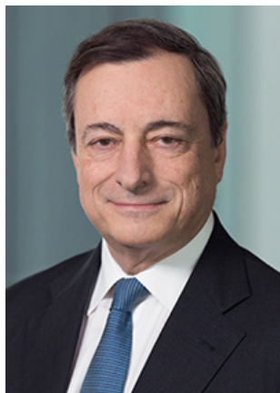
Mario Draghi, President tal-Bord Ewropew dwar ir-Riskju Sistemiku

Dan huwa s-sitt Rapport Annwali tal-Bord Ewropew dwar ir-Riskju Sistemiku (BERS), li jkopri l-perjodu bejn l-1 ta' April 2016 u l-31 ta' Marzu 2017. Fil-perjodu analizzat, il-BERS kompla jissorvelja mill-qrib il-vulnerabbiltajiet tas-sistema finanzjarja tal-Unjoni Ewropea (UE) u kkontribwixxa għad-dibattitu tal-politika relatat. Il-BERS ta attenzjoni partikolari lil żewġ żoni ta' riskju tal-akbar importanza. L-ewwel waħda hi relatata mar-riskji li jirriżultaw mill-ambjent fejn ir-rati tal-imgħax baqgħu baxxi. L-analiżi ta' dawn ir-riskji, li saret flimkien mill-BERS u l-BĊE, giet ippubblikata f'rapport dwar kwistjonijiet tal-politika makroprudenzjali li jirriżultaw mir-rati baxxi tal-imgħax. Din l-analiżi wasslet ukoll lill-BERS biex jikkunsidra r-riskju ta' dgħufijiet fil-karti tal-bilanċ tal-banek, l-assiguraturi u l-fondi tal-pensjoni bħala wieħed mill-iżjed żewġ riskji prominenti għall-istabbiltà finanzjarja fl-UE, li qies bħala tal-istess importanza bħal dik tar-riskju ta' riprezzar tal-primjums tar-riskju fis-swieq finanzjarji