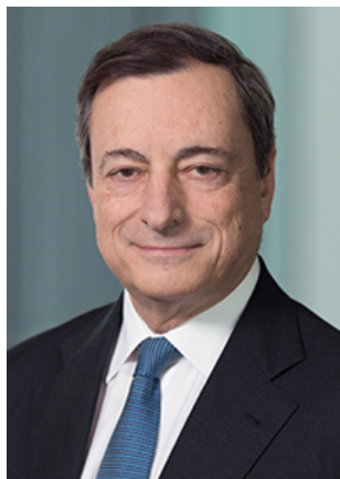
Mario Dragi, Eiropas Sistēmisko risku kolēģijas priekšsēdētājs

Šis ir Eiropas Sistēmisko risku kolēģijas (ESRK) sestais gada pārskats, kas aptver laikposmu no 2016. gada 1. aprīļa līdz 2017. gada 31. martam. Pārskata periodā ESRK turpināja rūpīgi monitorēt ievainojamības aspektus Eiropas Savienības (ES) finanšu sistēmā un piedalījās attiecīgajās politikas diskusijās. ESRK pievērsa īpašu uzmanību divām nozīmīgākajām riska jomām. Pirmā joma saistās ar ilgstoši zemu procentu likmju vides radītajiem riskiem. Šo risku analīze, ko kopīgi veikusi ESRK un ECB, publicēta ziņojumā par makroprudenciālās uzraudzības politikas jautājumiem, ko nosaka zemās procentu likmes. Pamatojoties uz šo analīzi, ESRK arī uzskata, ka risks, kas konstatēts saistībā ar banku, apdrošinātāju un pensiju fondu vājo bilanču stāvokli, ir viens no diviem būtiskākajiem ES finanšu stabilitātes riskiem, un atzīst to par līdzvērtīgu riskam, ko rada riska prēmiju pārvērtēšana pasaules finanšu tirgos.