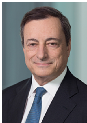
Mario Draghi, predsjednik Europskog odbora za sistemske rizike

Ovo je šesto godišnje izvješće Europskog odbora za sistemske rizike (ESRB), koje obuhvaća razdoblje od 1. travnja 2016. do 31. ožujka 2017. Tijekom promatranog razdoblja ESRB je nastavio pomno pratiti ranjivosti financijskog sustava Europske unije (EU) te je doprinio raspravi o politici koja je s time povezana. Posebnu pozornost ESRB je posvetio dvama najvažnijim područjima rizika. Prvo područje povezano je s rizicima svojstvenima okružju i dalje niskih kamatnih stopa. Analizu tih rizika zajednički su proveli ESRB i ESB, a objavljena je u izvješću o pitanjima makrobonitetne politike povezanima s niskim kamatnim stopama. Ta analiza također je potaknula ESRB da uzme u obzir utvrđeni rizik slabosti u bilancama banka, osiguravatelja i mirovinskih fondova kao jedan od dvaju najizraženijih rizika za financijsku stabilnost EU-a, čime ga je izjednačio s rizikom ponovnog određivanja cijena premija za rizik na svjetskim financijskim tržištima.