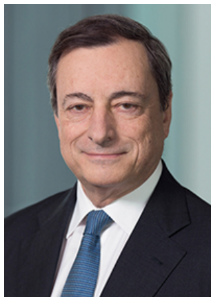
Mario Draghi, EJRK:n puheenjohtaja

Tämä Euroopan järjestelmäriskikomitean (EJRK) kuudes vuosikertomus kattaa ajanjakson 1.4.2016–31.3.2017. EJRK seurasi tuona aikana edelleen tarkasti Euroopan unionin rahoitusjärjestelmän haavoittuvuuksia ja osallistui tarvittavia toimia koskevaan keskusteluun. Erityisesti tarkasteltiin matalaan korkotasoon ja asuinkiinteistömarkkinoihin liittyviä riskejä. EJRK teki yhdessä EKP:n kanssa analyysin mataliin korkoihin liittyvistä riskeistä. Analyysin tulokset julkaistiin raportissa, joka käsitteli matalaan korkotasoon ja EU:n rahoitusjärjestelmän rakenteellisiin muutoksiin liittyviä makrovakauspoliittisia haasteita. Analyysin pohjalta EJRK totesi, että pankkien, vakuutusyhtiöiden ja eläkerahastojen taseiden heikkouksista aiheutuva riski oli yhtä huomattava uhka EU:n rahoitusjärjestelmän vakaudelle kuin riskipreemioiden uudelleenhinnoittelun riski kansainvälisillä rahoitusmarkkinoilla.