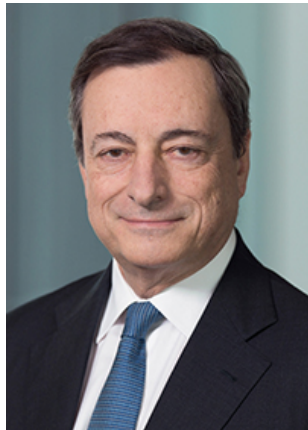
Mario Draghi, Ordförande för Europeiska systemrisknämnden

Under 2015 fortsatte Europeiska systemrisknämnden (ESRB) sin noggranna bevakning av möjliga källor till systemrisk i det europeiska finansiella systemet och den europeiska ekonomin. Emellanåt syntes tecken på ökade sårbarheter inom tre områden. Framför allt fanns det en betydande volatilitet på marknaden, som utlöstes av utvecklingen i viktiga tillväxtekonomier under hösten 2015 och som snabbt spreds till de globala finansmarknaderna, även den europeiska marknaden. ESRB var uppmärksam på risken för en korrigering på de globala finansmarknaderna och uppgraderade den risken till den högsta kategorin inför den här utvecklingen. I början av 2016 realiserades dessa sårbarheter delvis i en omgivning som kännetecknades av en fortsatt osäker global ekonomisk återhämtning, fortsatt svaga balansräkningar hos banker och försäkringsbolag i EU och höga nivåer av offentliga och privata skulder. För det andra fortsatte EU:s skuggbanksektor att växa och bli mer sammanflätad, vilket innebar att eventuella chocker i skuggbanksektorn kunde spridas till resten av det finansiella systemet. Slutligen bidrog den geopolitiska osäkerheten i nästan alla regioner som omger Europa till att hålla uppe oron.