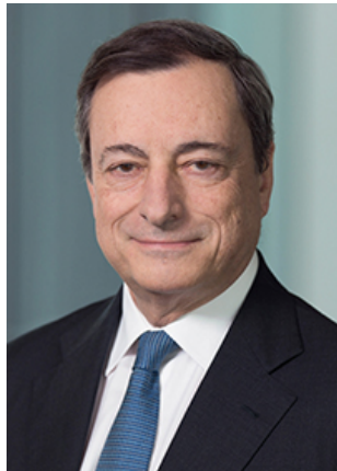
Mario Draghi, President tal-Bord Ewropew dwar ir-Riskju Sistemiku

Matul is-sena 2015, il-Bord Ewropew dwar ir-Riskju Sistemiku (BERS) kompli josserva mill-qrib is-sorsi potenzjali ta' riskji sistemici fis-sistema finanzjarja u fl-ekonomija Ewropea. Minn żmien għal żmien dehru sinjali li s-sitwazzjoni tal-vulnerabbiltajiet bdiet tisserja fi tliet oqsma. L-ewwel, kien hemm volatilità sinifikanti tas-suq ikkawżata minn żviluppi fl-ekonomiji tas-swieq emergenti ewlenin fil-ħarifa tal-2015, li malajr infirxet għas-swieq finanzjarji globali, fosthom dawk Ewropej. Il-BERS kien għassa għar-riskju ta' riprezzar fis-swieq finanzjarji globali u tellgħu fl-ogħla kategorija b'reazzjoni għal dawn l-iżviluppi. Fil-bidu tal-2016, dawn il-vulnerabbiltajiet seħħew parzjalment f'ambjent karatterizzat minn incertezza kontinwa fir-rigward tal-irkupru ekonomiku globali, b'dgħufijiet kontinwi fil-karti tal-bilanċ tal-banek u l-assiguraturi fl-UE kif ukoll b'livell għoli ta' dejn pubbliku u privat. It-tieni, is-settur bankarju parallel ( shadow banking ) tal-UE baqa' jikber fid-daqs u l-interkonnettività, u dan kien ifisser li l-iskossi u l-kontaġġu potenzjali