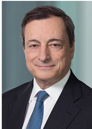
Mario Draghi EJRK:n puheenjohtaja

Vuonna 2015 Euroopan järjestelmäriskikomitea (EJRK) valvoi tarkasti tekijöitä, joista saattaisi aiheutua Euroopan rahoitusmarkkinoiden ja talouden vakautta uhkaavia järjestelmäriskejä. Vuoden aikana oli havaittavissa merkkejä haavoittuvuuden lisääntymisestä. Tärkein niistä oli rahoitusmarkkinoiden huomattava levottomuus, joka sai alkunsa keskeisten nousevien talouksien kehityksestä syksyllä 2015 ja levisi nopeasti myös Euroopan ja muun maailman rahoitusmarkkinoille. EJRK arvioi kehityksen lisäävän riskipreemioiden korjausliikkeen riskiä maailman rahoitusmarkkinoilla ja nosti sen vakavimpaan riskiluokkaan. Riski toteutuikin jossain määrin alkuvuodesta 2016, kun epävarmuus maailmantalouden elpymisestä jatkui, Euroopan unionin pankki- ja vakuutussektorin taserakenteissa oli edelleen heikkouksia ja julkisen ja yksityisen sektorin velkataakka oli suuri. Toinen haavoittuvuutta lisäävä tekijä oli varjopankkitoiminnan