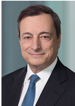
Mario Draghi, Euroopa Süsteemsete Riskide Nõukogu eesistuja

Euroopa Süsteemsete Riskide Nõukogu (ESRN) jätkas 2015. aastal Euroopa finantssüsteemis ja majanduses esinevate süsteemsete riskide võimalike allikate hoolikat jälgimist. Kolmes valdkonnas esines märke haavatavuse suurenemisest. Eelkõige täheldati turgude suurt volatiilsust, mis sai alguse peamistes areneva majandusega riikides 2015. aasta sügisel toimunud muutustest ja levis kiiresti maailma, sealhulgas Euroopa finantsturgudele. ESRN jälgis tähelepanelikult ümberhindluse riski maailma finantsturgudel ja tõstis selle nende muutuste tõttu kõrgeimasse kategooriasse. 2016. aasta alguses see haavatavus osaliselt realiseerus keskkonnas, mida iseloomustasid püsiv ebakindlus maailmamajanduse elavnemise suhtes, ELi pankade ja kindlustusandjate bilansside jätkuv nõrkus ning suur avaliku ja erasektori võlg. Teiseks suurenesid endiselt ELi varipangandussektori maht ja süsteemisene seotus, mis tähendab, et võimalikud šokid ja mõjud võivad kanduda