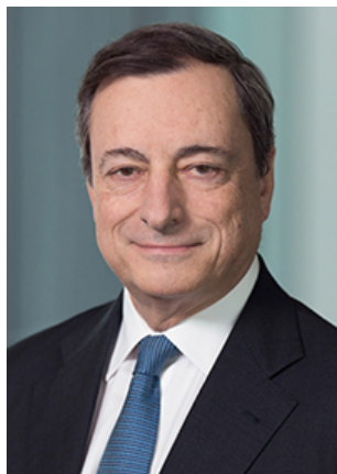
Mario Draghi, Euroopa Süsteemsete Riskide Nõukogu eesistuja

Euroopa Süsteemsete Riskide Nõukogu (ESRN) kuues aastaaruanne hõlmab ajavahemikku 1. aprillist 2016 kuni 31. märtsini 2017. Vaatlusalusel ajavahemikul jälgis ESRN jätkuvalt ja hoolikalt Euroopa Liidu (EL) finantssüsteemis esinevaid nõrkusi ning osales selleteemalistes aruteludes. Eelkõige pööras ESRN tähelepanu kahele olulisele riskivaldkonnale. Esimene on seotud riskidega, mis tulenevad püsivalt madalatest intressimääradest. ESRNi ja EKP ühisanalüüs selliste riskide kohta avaldati aruandes, mis käsitleb madalate intressimääradega seotud aspekte makrotasandi usaldatavusjärelvalve poliitikas. Kõnealuse analüüsi tulemustest lähtudes peab ESRN pankade, kindlustusandjate ja pensionifondide bilansside nõrkusega seotud riski üheks kahest suurimast riskist, mis ohustavad finantsstabiilsust Euroopa Liidus. Nimetatud riski peetakse sama oluliseks, kui on riskipremiate ümberhindluse risk üleilmsetel finantsturgudel.