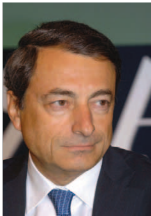
Mario Draghi Przewodniczący ERRS

Już czwarty rok z rządu Europejska Rada ds. Ryzyka Systemowego (ERRS) publikuje swój raport roczny. Obecne wydanie obejmuje okres od 1 kwietnia 2014 r. do 31 marca 2015 r. Był to pierwszy okres, w którym – dzięki wejściu w życie nowych unijnych przepisów bankowych (CRD IV/CRR) – organy makroostrożnościowe w Unii Europejskiej mogły same decydować o stosowaniu narzędzi makroostrożnościowych. ERRS odegrała w tym kluczową rolę: wydała zalecenie w sprawie utworzenia organów krajowych, które miałyby jasny i pełny mandat do działania oraz powinny opracować strategię stosowania środków makroostrożnościowych, aby w razie potrzeby były one gotowe do użycia. Tym samym zakończył się pierwszy etap tworzenia w Europie polityki makroostrożnościowej. Tylko kilka państw członkowskich nie uchwaliło jeszcze odpowiednich aktów prawnych w tym zakresie – apeluję do nich o podjęcie odpowiednich działań zgodnie z zaleceniami ERRS.