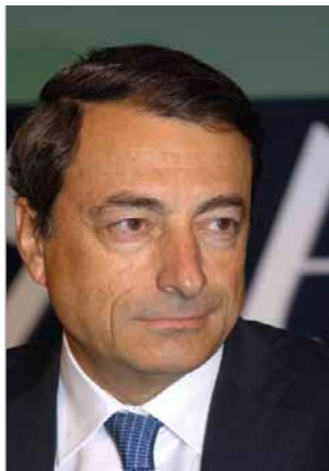
Mario Draghi ESRNi eesistuja

Euroopa Süsteemsete Riskide Nõukogu (ESRN) neljas aastaaruanne hõlmab ajavahemikku 1. aprillist 2014 kuni 31. märtsini 2015. Uute pangandust puudutavate ELi õigusaktide (kapitalinõuete direktiiv ja määrus, CRD IV/CRR) jõustumise järel on makrotasandi usaldatavusjärelvalve asutustel esmakordselt olnud võimalus kasutada oma äranägemise järgi Euroopa Liidus makrotasandi usaldatavusjärelvalve vahendeid. ESRN on etendanud tähtsat osa, soovitades luua riikide asjakohased asutused, kellele on antud selged ja täielikud poliitilised volitused ning kes töötavad välja strateegiad poliitiliste meetmete võtmiseks, kui see on vajalik. Seega on makrotasandi usaldatavusjärelvalve poliitika loomise esimene etapp Euroopas lõpule jõudnud. Vaid vähesed liikmesriigid ei ole veel kõnealuseid õigusakte vastu võtnud ja siinkohal soovin kutsuda neid üles järgima ESRNi soovitusi.