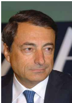
Mario Draghi předseda Evropské rady pro systémová rizika

Toto je čtvrtá výroční zpráva Evropské rady pro systémová rizika (ESRB) za období od 1. dubna 2014 do 31. března 2015. Se vstupem nových právních předpisů EU v oblasti bankovníctví (CRD IV / CRR) v platnost je to také první období, v němž měly orgány makrobezpečnostního dohledu možnost použít v Evropské unii makrobezpečnostní nástroje podle vlastního uvážení. ESRB sehrála jednu z klíčových úloh tím, že doporučila, aby byly ustaveny vnitrostátní orgány s jednoznačným a úplným mandátem a aby tyto orgány vypracovaly strategie k přípravě opatření, kdykoli to bude třeba. Byla tak završena první etapa vytvoření makrobezpečnostních politik v Evropě. Tyto právní předpisy zatím nepřijalo jen několik členských států a rád bych je naléhavě vyzval, aby na doporučení ESRB navázaly.