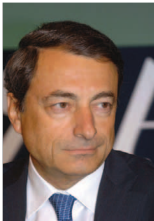
Марио Драги Председател на Европейския съвет за системен риск

Това е четвъртият годишен доклад на Европейския съвет за системен риск (ЕССР). Той обхваща периода от 1 април 2014 г. до 31 март 2015 г. След влизането в сила на новите законодателни актове на ЕС в областта на банковото дело (ДКИ IV/РКИ) това е и първият период, в който макропруденциалните органи имаха възможност да използват по свое усмотрение макропруденциалните инструменти в Европейския съюз. ЕССР изигра ключова роля, като препоръча да бъдат създадени национални органи, предложи да им бъде възложен ясен и изчерпателен мандат по отношение на политиките и задачата им да бъде да изработват стратегии в подготовка за мерки по политиките, които да могат да бъдат предприети при необходимост. По този начин завърши първият етап на установяването на макропруденциални политики в Европа. Само малък брой държави членки все още не са приели такова законодателство и аз бих искал да ги призова да последват препоръките на ЕССР.