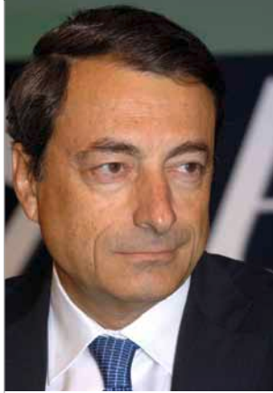
Mario Draghi Ordförande för Europeiska systemrisknämnden

Jag är mycket nöjd över att kunna presentera Europeiska systemrisknämndens (ESRB) tredje årsrapport. ESRB inrättades 2010 som ett oberoende organ inom Europeiska unionen (EU) och har ansvar för makrotillsynen av EU:s finansiella system. Rapporten omfattar perioden 1 april 2013 till 31 mars 2014.