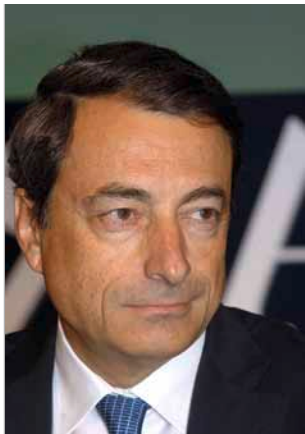
Mario Draghi predseda Európskeho výboru pre systémové riziká

S potešením predkladám tretiu výročnú správu Európskeho výboru pre systémové riziká (European Systemic Risk Board – ESRB), ktorý bol zriadený v roku 2010 ako nezávislý orgán Európskej únie (EÚ) zodpovedný za makroprudenciálny dohľad nad finančným systémom EÚ. Správa sa týka obdobia od 1. apríla 2013 do 31. marca 2014.