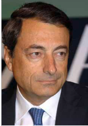
Mario Draghi Președintele Comitetului european pentru risc sistemic

Am plăcerea de a vă prezenta cel de-al treilea Raport anual al Comitetului european pentru risc sistemic (CERS), care a fost înființat, în anul 2010, ca organism independent al Uniunii Europene (UE), pentru a prelua responsabilitatea supravegherii macroprudențiale a sistemului financiar al UE. Raportul se referă la perioada 1 aprilie 2013-31 martie 2014.