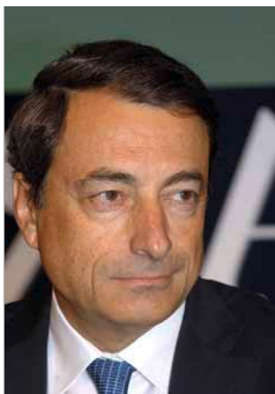
Mario Draghi Eiropas Sistēmisko risku kolēģijas priekšsēdētājs

Priecājos par iespēju iepazīstināt ar trešo gada pārskatu, ko sagatavojusi Eiropas Sistēmisko risku kolēģija (ESRK). ESRK izveidota 2010. gadā kā neatkarīga Eiropas Savienības (ES) struktūra, kas uzņemas atbildību par ES finanšu sistēmas makroprudenciālo uzraudzību. Pārskats aptver periodu no 2013. gada 1. aprīļa līdz 2014. gada 31. martam.