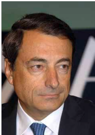
Mario Draghi predsjednik Europskog odbora za sistemske rizike

Sa zadovoljstvom predstavljam treće Godišnje izvješće Europskog odbora za sistemske rizike (ESRB), koji je osnovan 2010. kao neovisno tijelo Europske unije (EU), odgovorno za makrobonitetni nadzor financijskog sustava EU-a. Izvješćem je obuhvaćeno razdoblje od 1. travnja 2013. do 31. ožujka 2014.