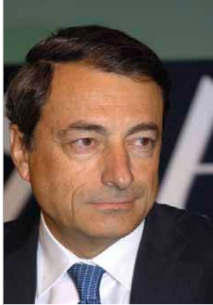
Mario Draghi EJRK:n puheenjohtaja

Tämä on Euroopan järjestelmäriskikomitean (EJRK) kolmas vuosikertomus. EJRK on riippumaton Euroopan unionin (EU) elin, joka on vuodesta 2010 huolehtinut rahoitusjärjestelmän makrovakauden valvonnasta unionissa. Raportti kattaa ajanjakson 1.4.2013–31.3.2014.