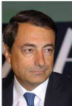
Mario Draghi ESRNI eesistuja

Mul on hea meel esitleda Euroopa Süsteemsete Riskide Nõukogu (ESRN) kolmandat aastaaruannet. ESRN loodi 2010. aastal Euroopa Liidu (EL) finantsüsteemi makrotasandi usaldatavusjärelvalve eest vastutava sõltumatu organina.