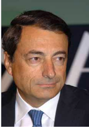
Марио Драги Председател на Европейския съвет за системен риск

Удоволствие за мен е да представя третия Годишен доклад на Европейския съвет за системен риск (ЕССР), който беше създаден през 2010 г. като независим орган на Европейския съюз (ЕС), за да поеме задачите по макропруденциалния надзор на неговата финансова система. Докладът обхваща периода от 1 април 2013 г. до 31 март 2014 г.