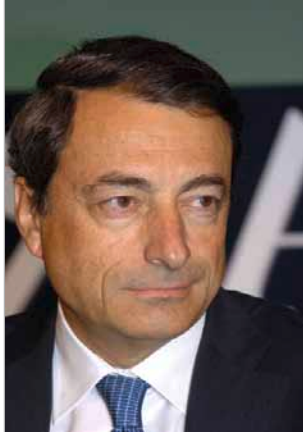
Mario Draghi Voorzitter van het Europees Comité voor Systeemrisico's

Het doet mij veel genoegen hierbij het derde Jaarverslag te presenteren van het Europees Comité voor Systeemrisico's (European Systemic Risk Board ofwel ESRB), dat in 2010 is opgericht als een onafhankelijk orgaan van de Europese Unie om de verantwoordelijkheid op zich te nemen voor het macroprudentieel toezicht op het financiële stelsel van de EU. Het verslag heeft betrekking op de periode 1 april 2013 tot en met 31 maart 2014.