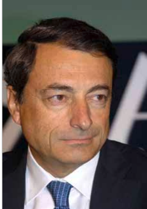
Mario Draghi President tal-Bord Ewropew dwar ir-Riskju Sistemiku

Għandi l-pjaċir nippreżenta t-tielet Rapport Annwali tal-Bord Ewropew dwar ir-Riskju Sistemiku (BERS) li twaqqaf fl-2010 bħala korp indipendenti tal-Unjoni Ewropea biex jieħu f'idejha is-sorveljanza makroprudenzjali tas-sistema finanzjarja tal-Unjoni Ewropea. Ir-rapport jiġbor fih il-perjodu bejn l-1 ta' April 2013 u l-31 ta' Marzu 2014.