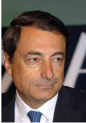
Mario Draghi Formand for Det Europæiske Udvalg for Systemiske Risici

Det glæder mig at præsentere den tredje årsberetning fra Det Europæiske Udvalg for Systemiske Risici (ESRB). ESRB blev oprettet i 2010 som et selvstændigt EU-organ med ansvar for det makroprudentielle tilsyn med det finansielle system i EU. Beretningen vedrører perioden 1. april 2013 til 31. marts 2014.