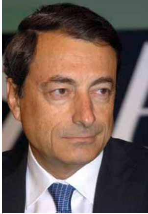
Mario Draghi předseda Evropské rady pro systémová rizika

S potěšením Vám předkládám třetí výroční zprávu Evropské rady pro systémová rizika (ESRB), která byla založena v roce 2010 jako nezávislá instituce Evropské unie (EU) odpovědná za makrobezpečnostní dohled nad finančním systémem EU. Tato zpráva se vztahuje na období od 1. dubna 2013 do 31. března 2014.