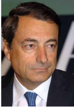
Mario Draghi Voorzitter van het Europees Comité voor Systeemrisico's

Het doet mij veel plezier hierbij het tweede Jaarverslag te presenteren van het Europees Comité voor Systeemrisico's (European Systemic Risk Board ofwel ESRB), het onafhankelijke orgaan van de Europese Unie (EU) dat verantwoordelijk is voor het macro-prudentieel toezicht op het financiële stelsel van de EU en waarvoor de Europese Centrale Bank (ECB) het Secretariaat voert en waaraan zij analytische, statistische, logistieke en administratieve ondersteuning geeft. Dit verslag geeft een getrouw beeld van de activiteiten van het ESRB gedurende het tweede jaar van zijn bestaan. Het is een jaar geweest van intensieve werkzaamheden gericht op het opzetten van een degelijk macro-prudentieel kader binnen de gehele EU, en daarbij tegelijkertijd systeemrisico's in het financiële stelsel van de EU in kaart te brengen en actie te ondernemen om deze risico's te beperken.